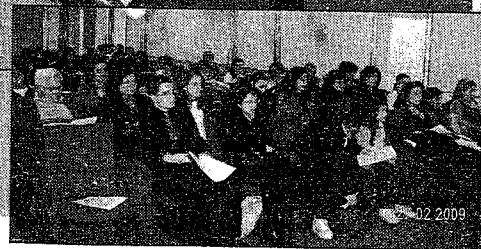
Nelle foto alcuni momenti dell'incontro al liceo scientifico Pellecchia

pevolezza, la verità delle cose. L'inquietudine umana che vorrebbero morfinizzare ma che è ciò che caratterizza l'uomo e lo distingue dagli animali e dagli oggetti, il